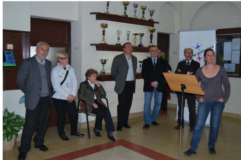
Inauguració Art a l'escola 2010